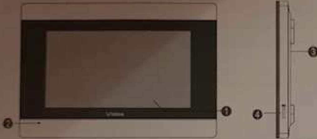
Fig2 type videos M903-S video intercom